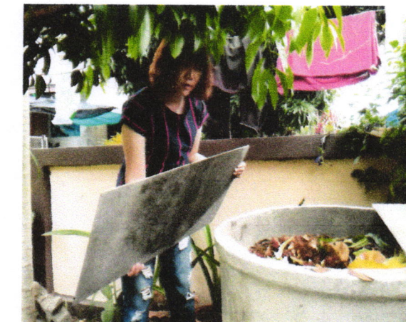
การทำปุ๋ยจากเศษขยะเปียกในครัวเรือน