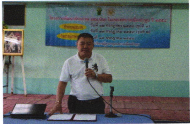
ภาพแสดงกิจกรรมการเปิดโครงการพัฒนาศักยภาพอสม.น้อยเทศบาลเมืองลำพูนประจำปี ๒๕๕๙