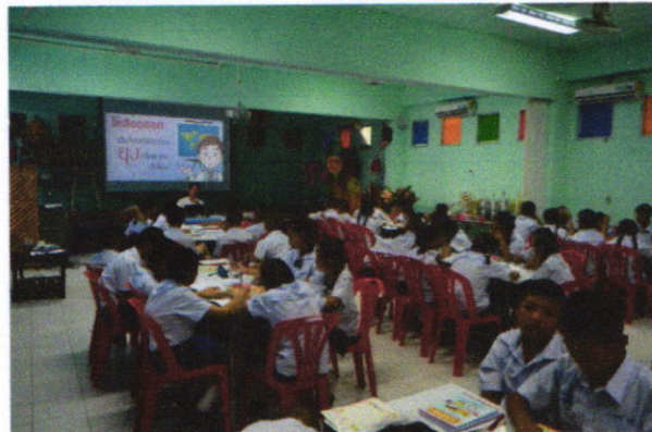
ภาพแสดงกิจกรรมวิทยากรให้ความรู้วิธีการดูแลป้องกันโรคเบาหวาน โรคความดันโลหิตสูง และโรคไขข้ออักเสบ