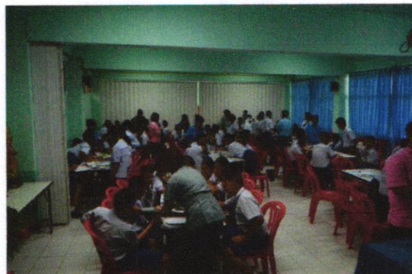
ภาพแสดงกิจกรรมวิทยากรพี่เลี้ยงฝึกปฏิบัติการใช้เครื่องวัดความดันโลหิตแก่อสม.น้อย